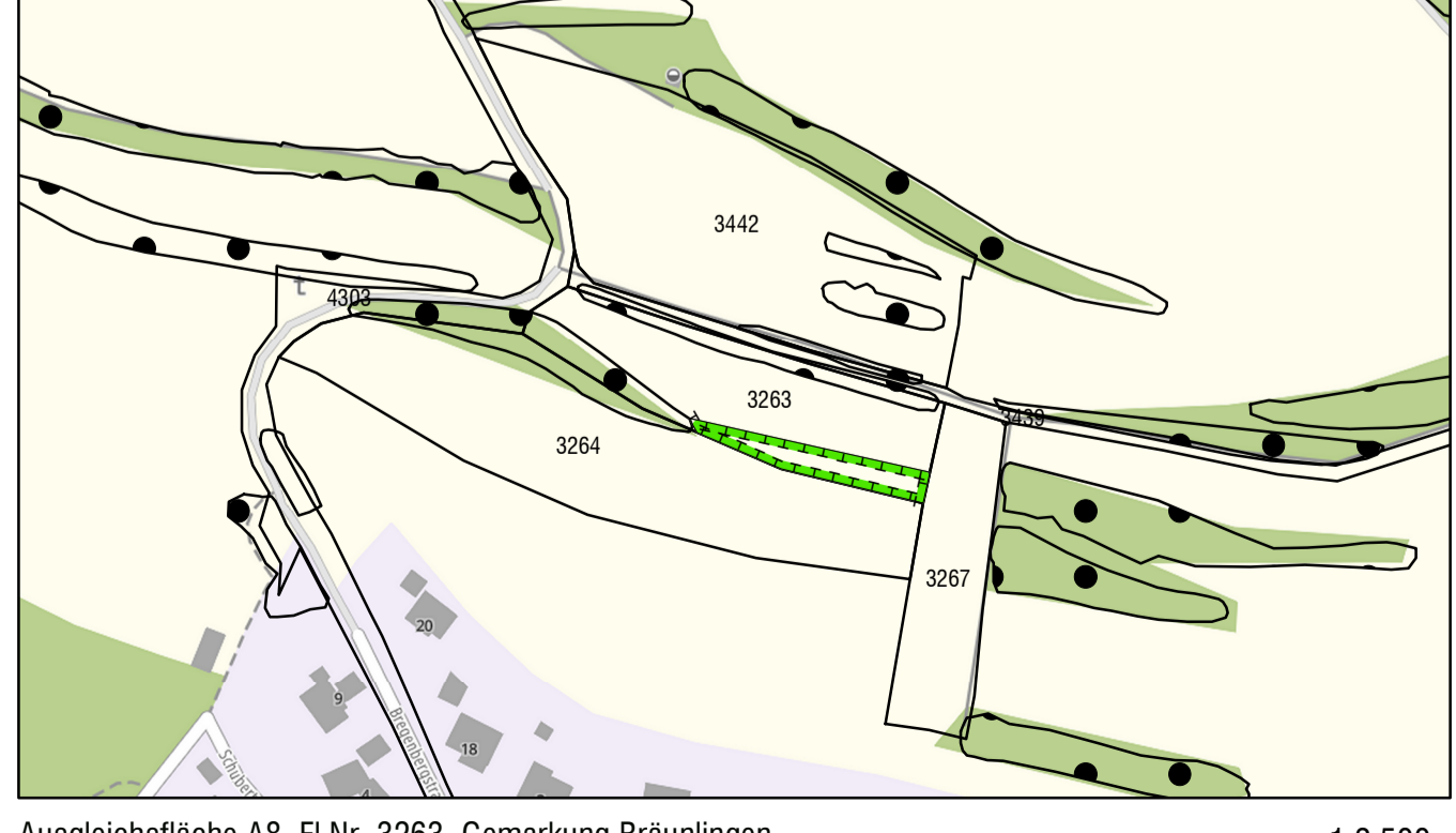
Ausgleichsfläche A8, Fl.Nr. 3263, Gemarkung Braunlingen 1:2.500