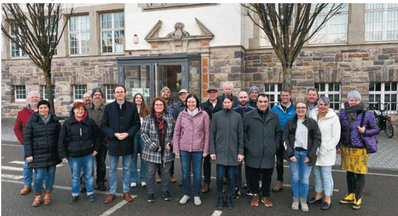
Besichtigung Grundschule: Gemeinderat, Bürgermeister, Schulleitung und Verwaltung informieren sich über den Stand der Bauarbeiten.